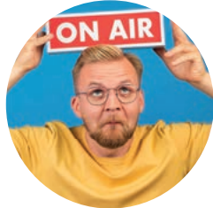
Max Haß Foto- & Videograf