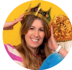
Nadine Brinkmann Foto- & Videografin