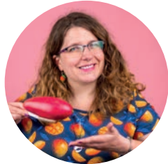
Kristina Sicking Webdesign | Webentwicklung