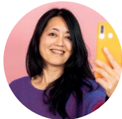
Renée Repotente Leitung Redaktion & Text