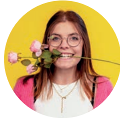
Nadine Schwengels Grafik | Social Media