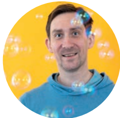
Ralf Wegner Webdesign | Webentwicklung