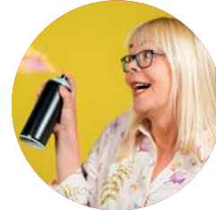
Ilka Sievers Grafik | IHK-Wirtschaftsmagazine