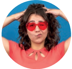
Sophie Hehlert Grafik | Social Media