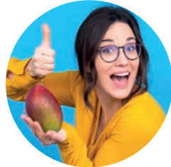
Corinna Scharneweber Grafik